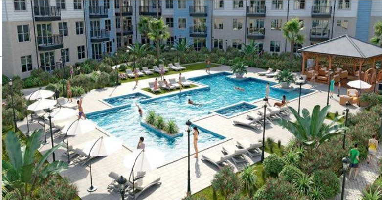
Little Elm USA Texas