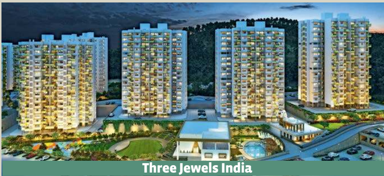
Three Jewels India