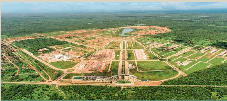
Smart city Laguna Brasile